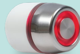
PIÈCE À MAIN ONDA DINAMICA® ROUGE POUR LE VISAGE

DEUX PIÈCES À MAIN SPÉCIFIQUES POUR RÉVEILLER LA VITALITÉ DE LA PEAU ET LUTTER CONTRE LES IMPERFECTIONS DU VISAGE ET DU CORPS.